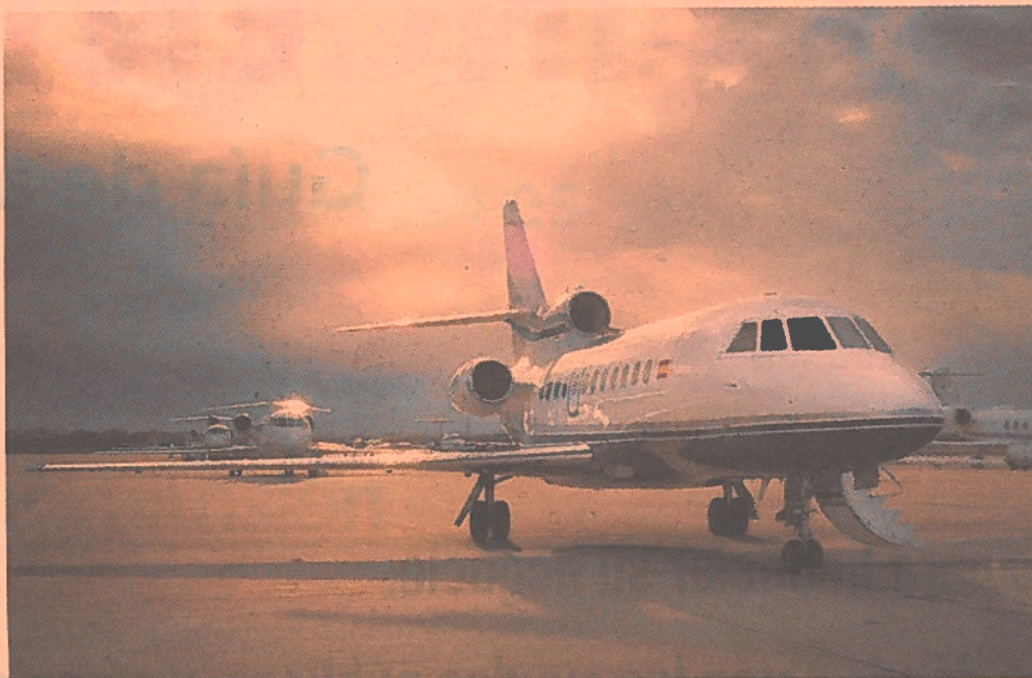
Gestair opera, en la actualidad, una flota de 37 ‘jets’ privados bajo gestión.

Mientras, la operación de Executive, cuyo precio se desconoce, incluye un variable ligado al éxito del proyecto conjunto y a la salida del capital de Nazca. Un escenario que, a corto plazo, parece descartado: “El fondo no está en